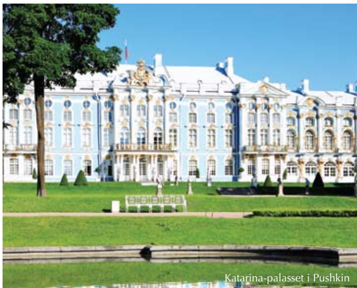
Katarina-palasset i Pushkin